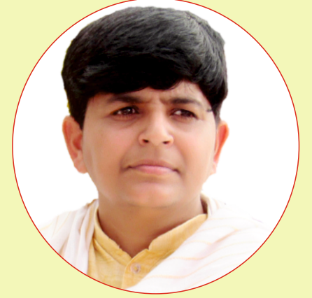
बहन प्रवेश आर्या