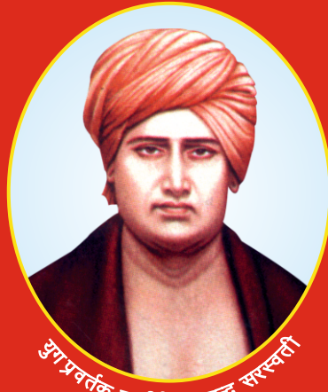
ॐ प्रवर्तक महर्षि दयानन्द सरस्वती