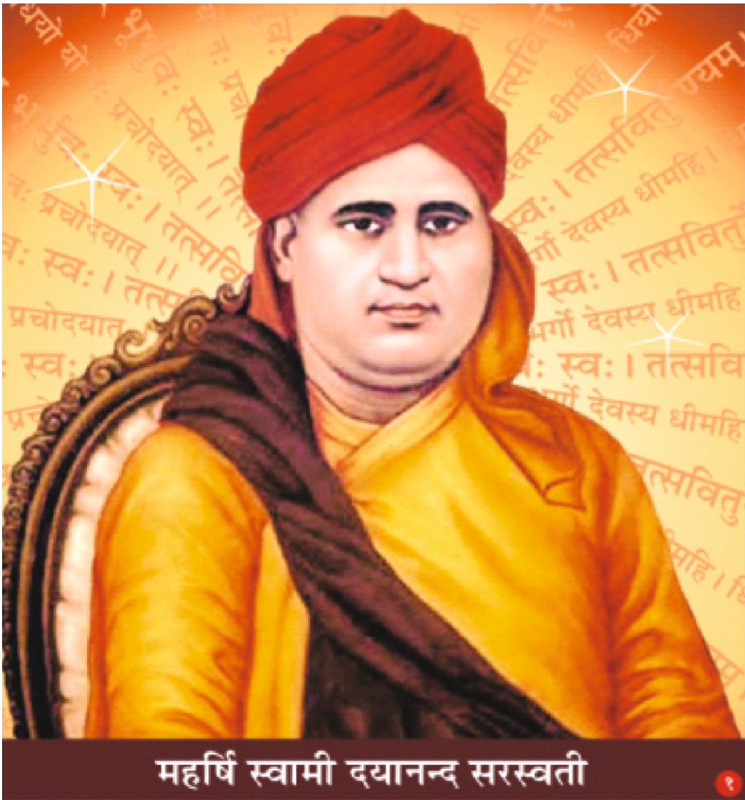
महर्षि स्वामी दयानन्द सरस्वती

“आर्य समाज ने भारतीय चिन्ता को झकझोर दिया था, पर प्राचीन आप्त वाक्य को मानने की प्रवृत्ति को उसने और भी अधिक प्रतिष्ठित किया। इसका परिणाम सभी क्षेत्रों में देखा गया। साहित्य के क्षेत्र में भी इस समय तक प्रमाण ग्रन्थों के आधार पर विवेचना करने की प्रथा चल पड़ी थी।” हिन्दी साहित्य के लिए आर्य समाज की यह ठोस सेवा है। धर्म के समान ही समाज में भी आर्य समाज ने आमूल परिवर्तन के लिए कठिन प्रयास किया और शिक्षा के क्षेत्र में सम्पूर्ण प्रणाली को ही प्राचीन विद्या तथा आर्य भाषा के दृढ़ आधार पर स्थित किया। इस प्रकार हिन्दी भाषा एवं साहित्य के विकास में आर्य समाज का योगदान महत्त्वपूर्ण है।