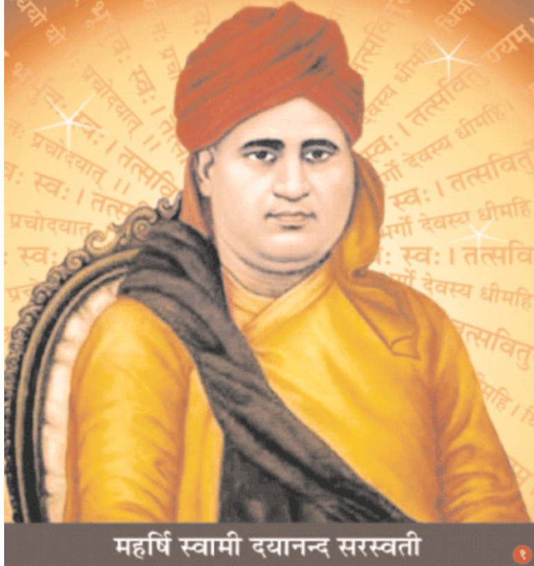
महर्षि स्वामी दयानन्द सरस्वती

स्वामी जी मूर्तिपूजा को सब बुराईयों की जड़ मानते