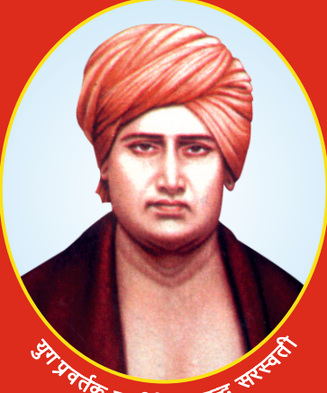
ॐ प्रवर्तक महर्षि दयानन्द सरस्वती