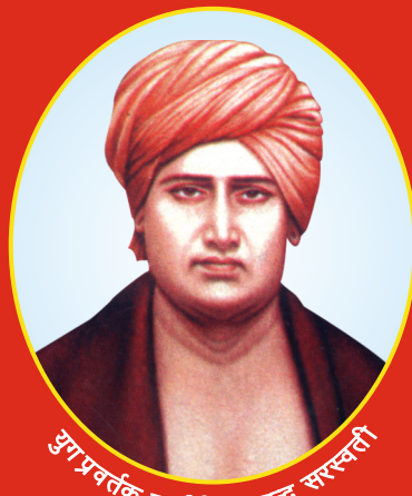
युग प्रवर्तक महर्षि दयानन्द सरस्वती