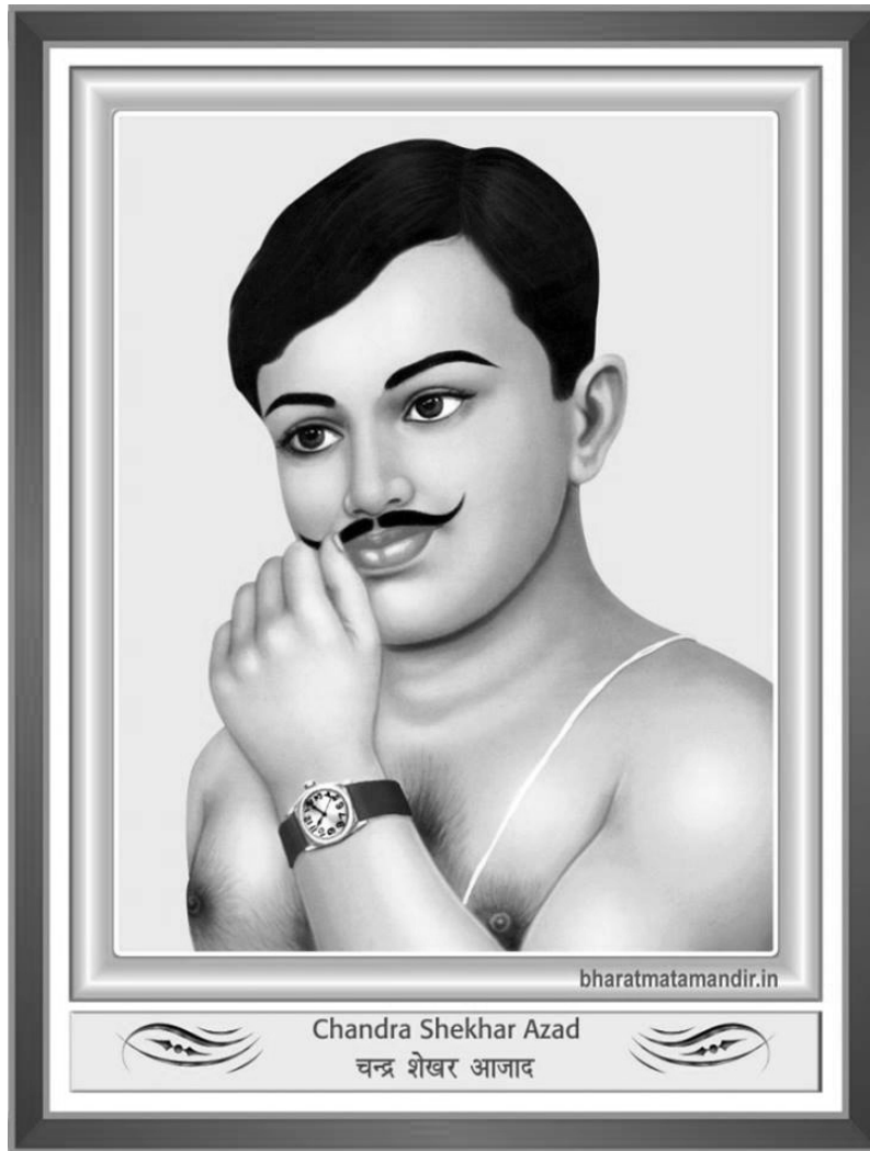
Chandra Shekhar Azad चन्द्र शेखर आजाद

रामप्रसाद बिस्मिल, चन्द्रशेखर आजाद, अशफाक उल्ला खॉ अन्य क्रान्तिकारियों के सहयोग से 9 अगस्त, 1925 को सरकारी खजाना लूटने के योजना बनाई गई। काकोरी रेलवे स्टेशन (उ. प्र.) में रेल रोककर सरकारी खजाना पिस्तौल के