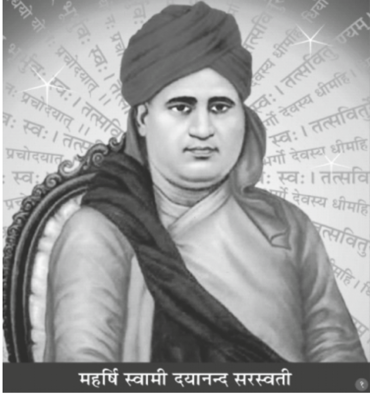
महर्षि स्वामी दयानन्द सरस्वती

आजकल साक्षरता पर बड़ा जोर दिया जा रहा है, सभी को शिक्षित करने का लक्ष्य है। इस दिशा में लोक जुम्बिश, शिक्षाकर्म योजना, सरस्वती योजना और शिक्षा के सार्वजनीकरण की योजना इस हेतु चलाई जा रही है। इस पर करोड़ों रुपये व्यय किये जा रहे हैं। एक सौ तिरसठ वर्ष पहिले इसका एक व्यावहारिक हल बताया जो सत्यार्थ प्रकाश के तृतीय समुल्लास से अविकल उद्भूत है -