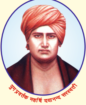
आध्यात्मिक महर्षि दयानन्द सरस्वती

दिनांक : 2 मार्च, 2021 (मंगलवार) से 14 मार्च, 2021 (रविवार) तक